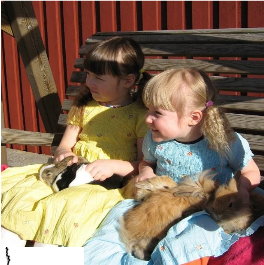
Tytöt hoivaavat kaneja